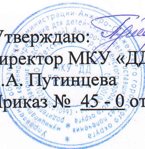
ГРАФИК ПРИЕМА И ПОСЕЩЕНИЙ ЛИЦ, ЖЕЛАЮЩИХ УСЫНОВИТЬ (УДОЧЕРИТЬ) ИЛИ ПРИНЯТЬ ПОД ОПЕКУ (ПОПЕЧИТЕЛЬСТВО) РЕБЕНКА С УЧЕТОМ РЕЖИМА ДНЯ ДЕТЕЙ на 2023 год